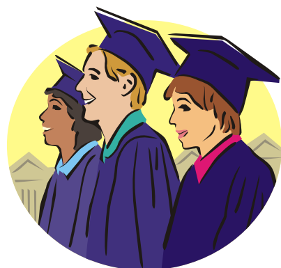
memoria iuris consultorum